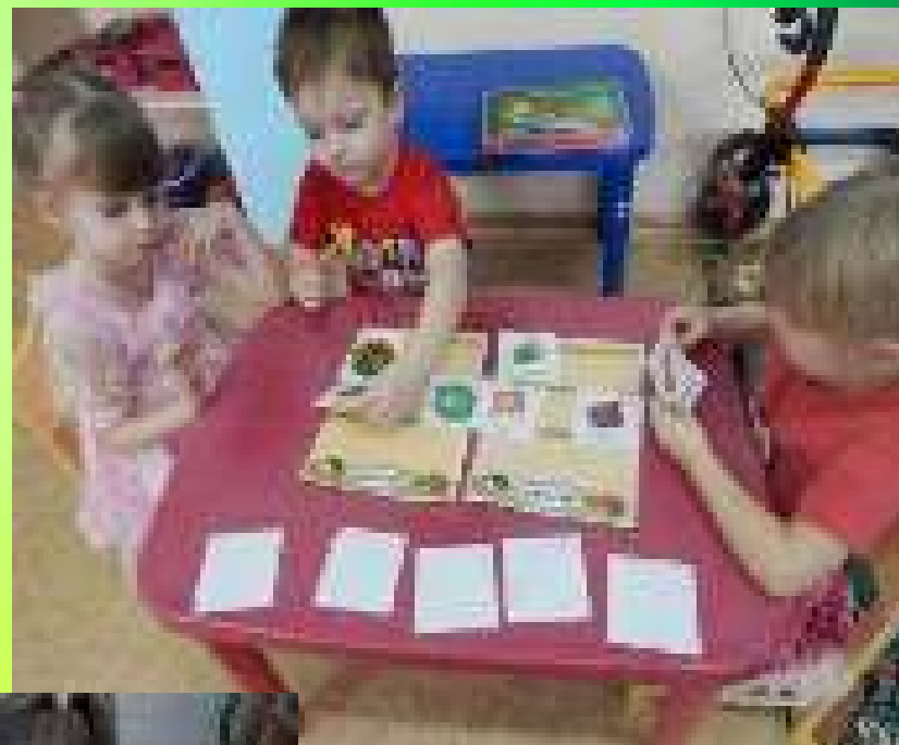
Дидактическая игра «Магазин. Овощи. Фрукты. Ягоды.»