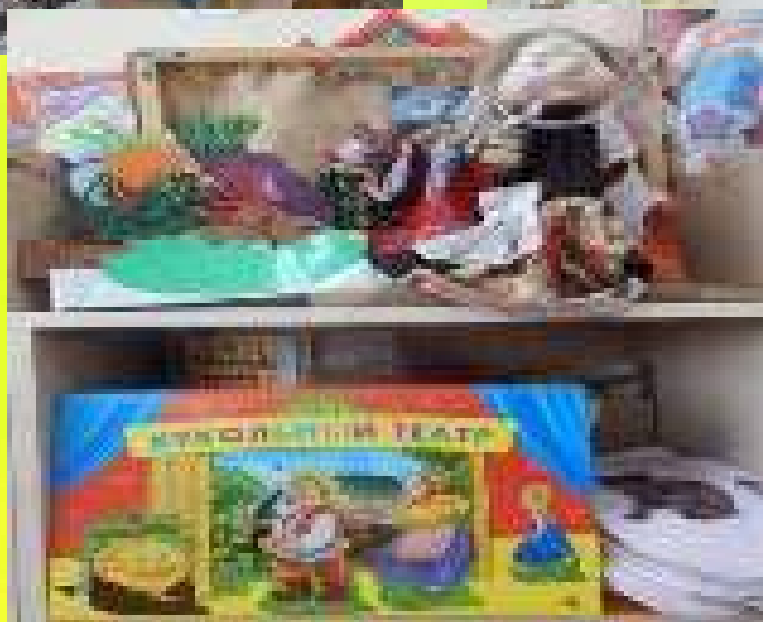
Центр музыкально-театрализованной деятельности