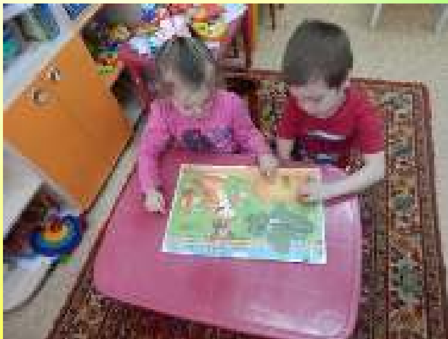
Рассматривание иллюстраций к сказке «Репка»