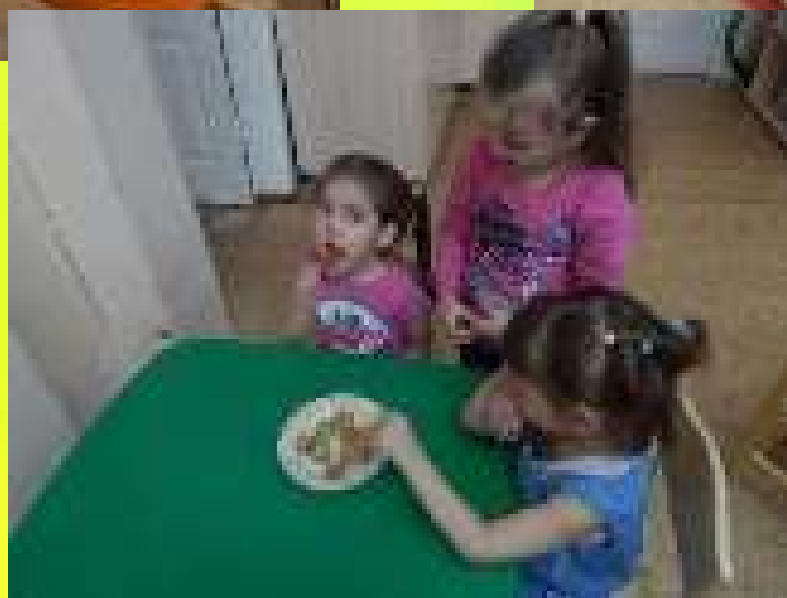
Дидактическая игра «Узнай на вкус»