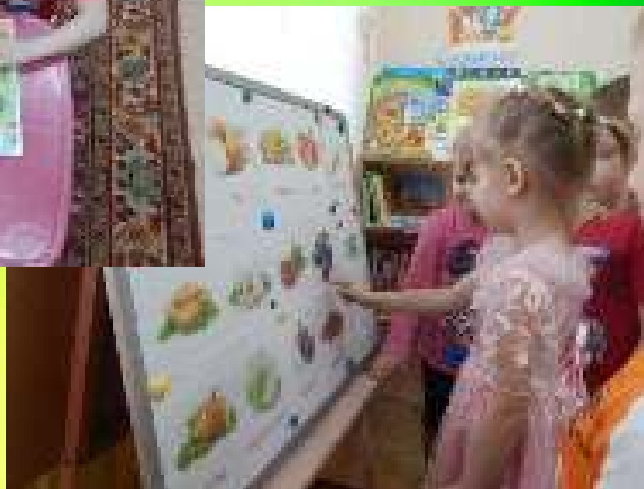
Рассматривание картинок «Что растет в огороде»