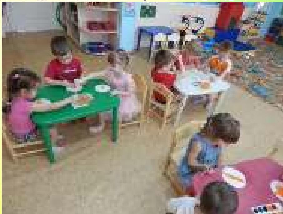
Рисование «Морковь на тарелочке»