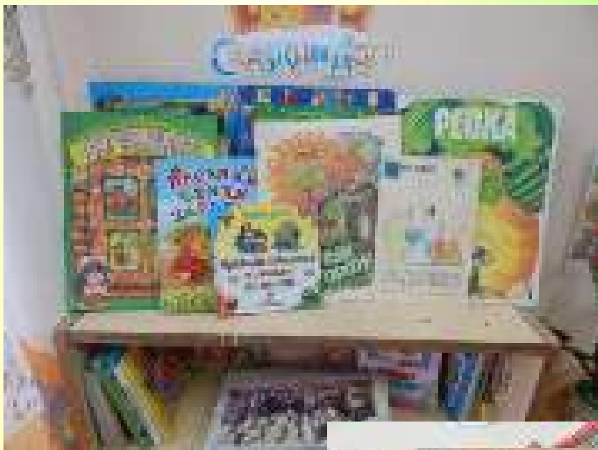
Центр книги «Сказкин дом»