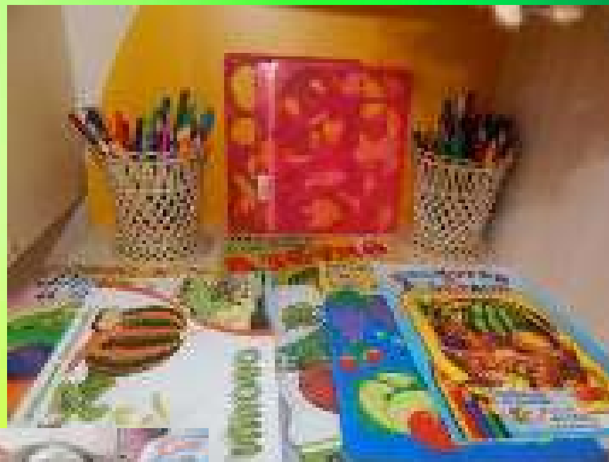
Уголок творчества «Умелые руки»