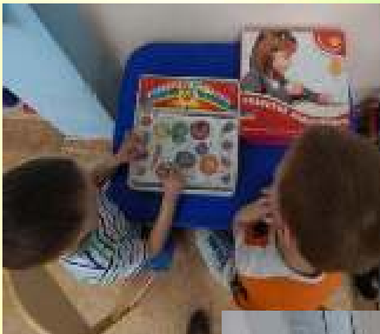
Дидактическая игра «Что сажают в огороде»