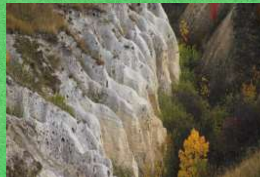
4 Чертов овраг