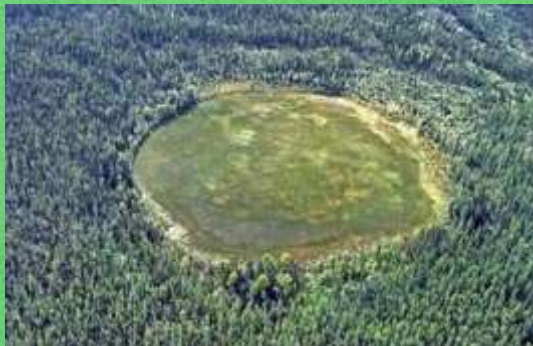
1 Чертова поляна