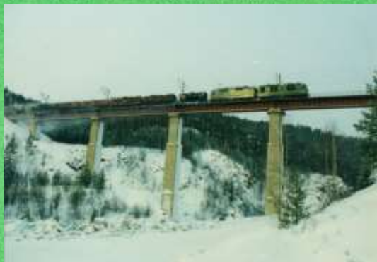
3 Чертов мост