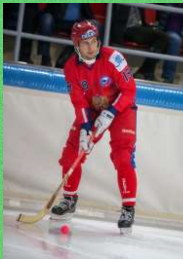
Хоккей с мячом