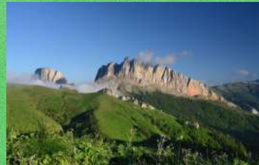
2 Чертовы ворота